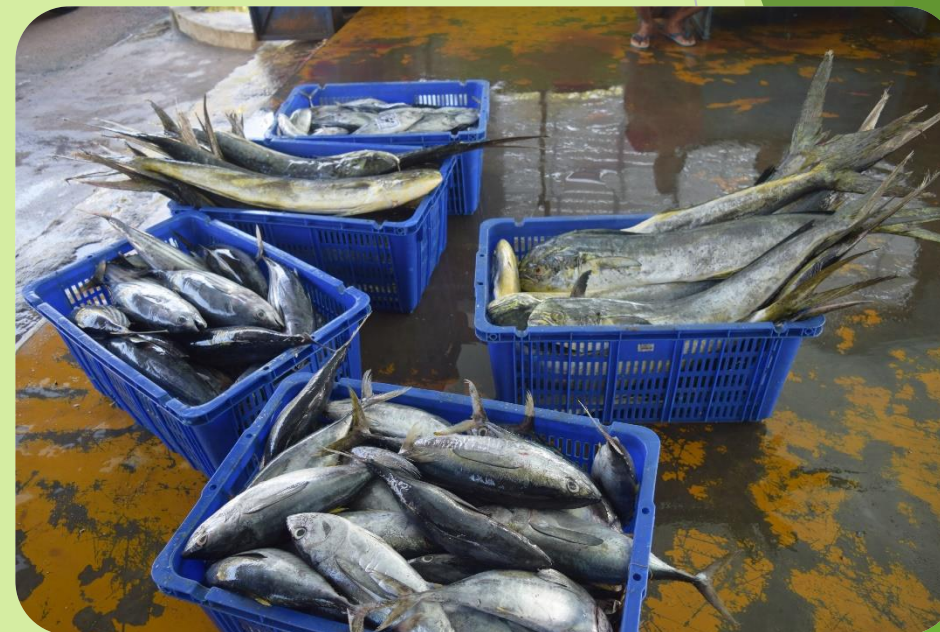
KAPAL YANG MELAKUKAN BONGKAR