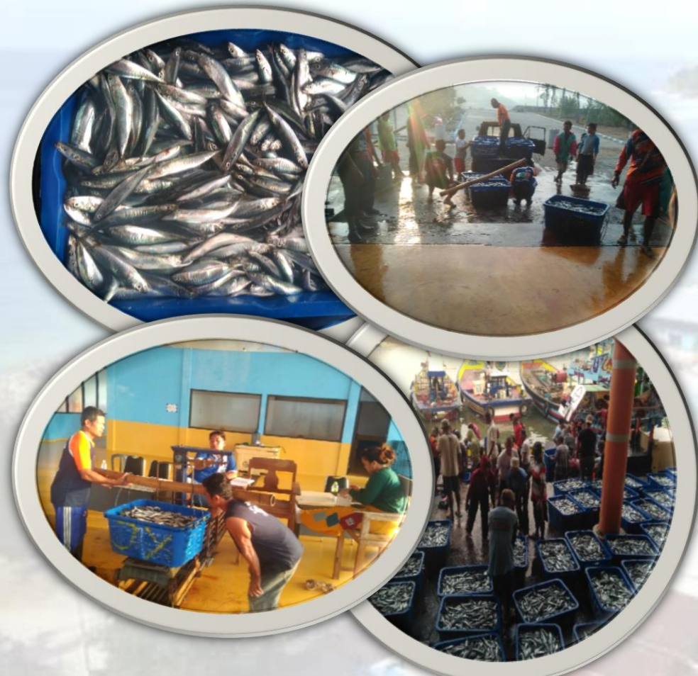
FOTO KEGIATAN :

INFORMASI DATA PRODUKSI PERIKANAN HARIAN