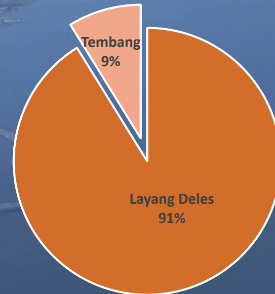
Nilai Produksi Ikan (Kg)