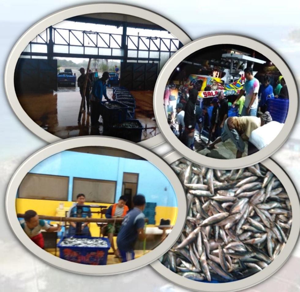
FOTO KEGIATAN :

INFORMASI DATA PRODUKSI PERIKANAN HARIAN