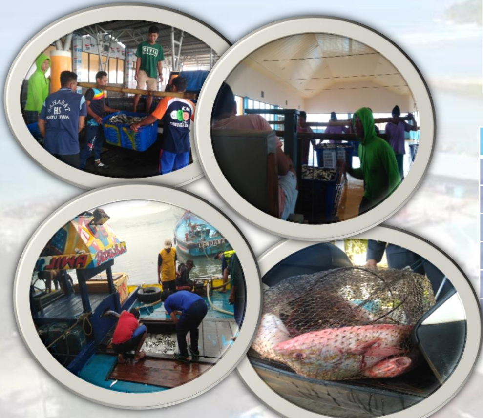
FOTO KEGIATAN :

INFORMASI DATA PRODUKSI PERIKANAN HARIAN