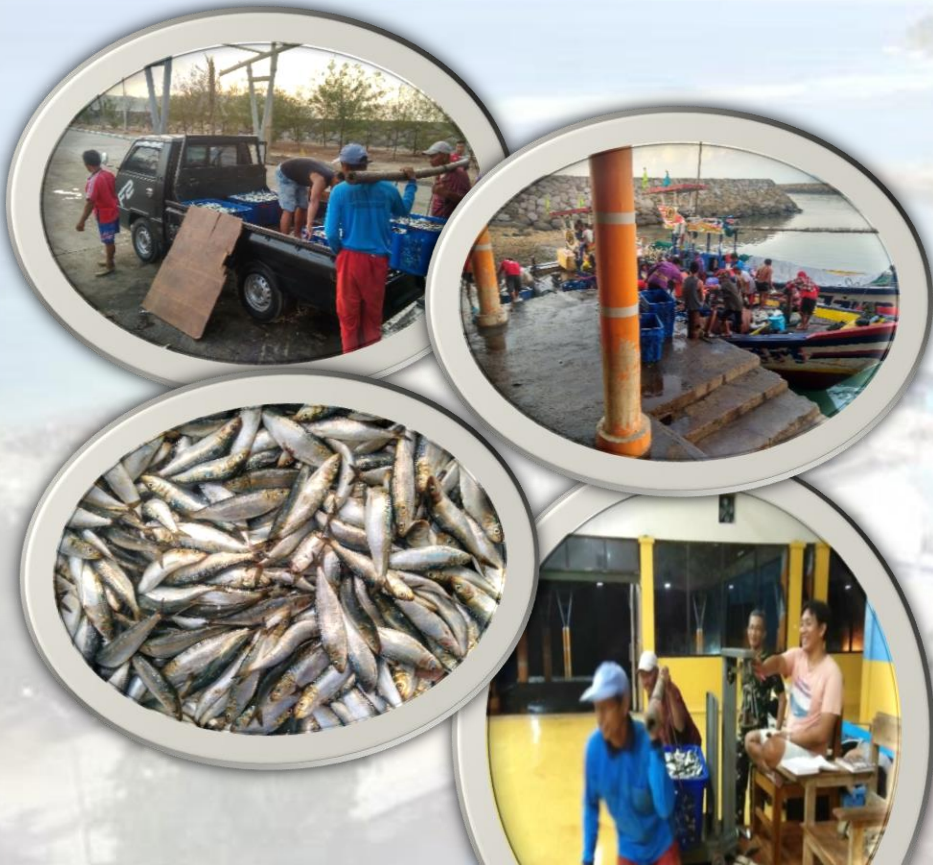
FOTO KEGIATAN :

INFORMASI DATA PRODUKSI PERIKANAN HARIAN