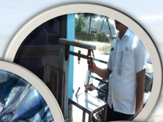
FOTO KEGIATAN :